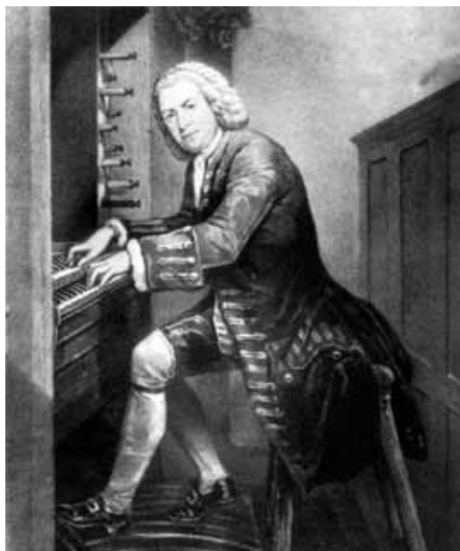
JOHANN SEBASTIAN BACH

OMAGGIO A JOHANN SEBASTIAN BACH (1685-1750)