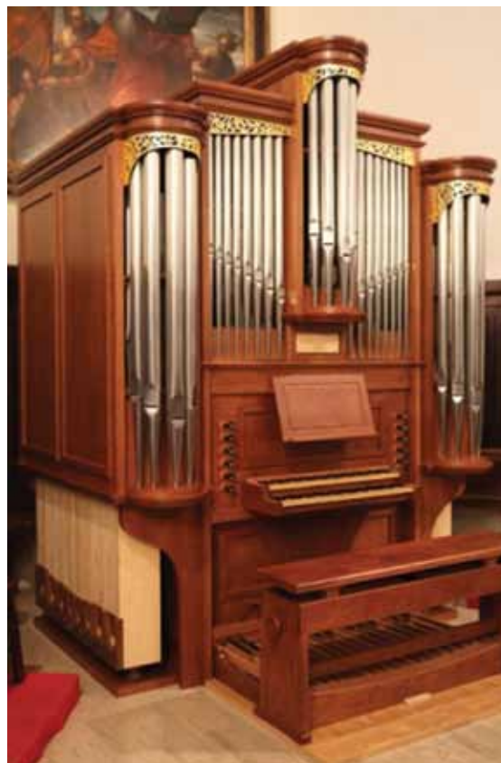
ORGANO MICHELI 2011

ore 13:00 MONZAMBANO (MN) Pranzo (Ristorante vicino alla Chiesa parrocchiale)