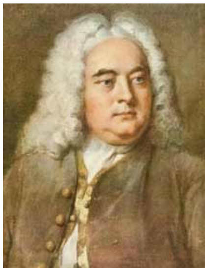
GEORG FRIEDRICH HAENDEL