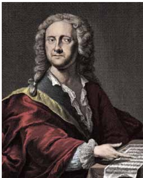
GEORG PHILIPP TELEMANN