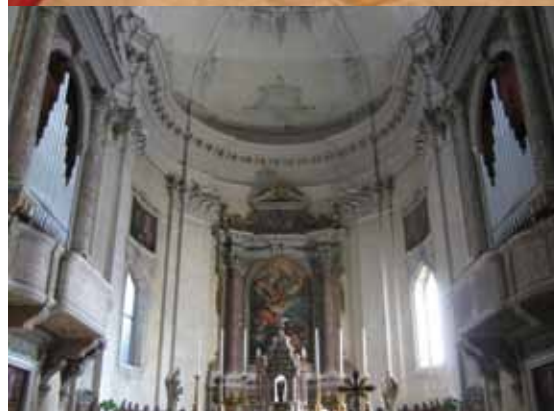
ORGANO MICHELI 2017