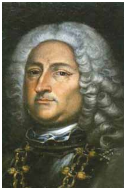
GIOVANNI BENEDETTO PLATTI